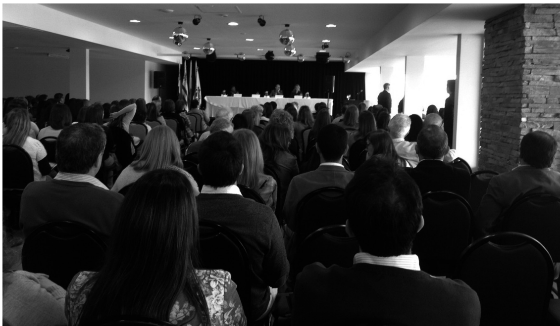
(Participantes de las Jornadas durante una de las Conferencias.)