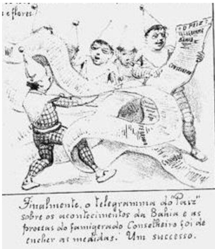
Imagen 1 - «Finalmente, o telegrama do "Paiz" sobre os acontecimentos da Bahia e as proezas do famigerado Conselheiro foi de encher as medidas. Um sucesso», Revista Ilustrada , Rio de Janeiro, enero de 1897, 4.

Canudos es el evento más estudiado en la historia brasileña y sobre el mismo se multiplican diversos relatos. El acontecimiento histórico de «La guerra de Canudos» (1893-1897) se ha transformado en una experiencia modélica para varios estudios teórico-críticos sobre el pensamiento latinoamericano. El episodio bélico se desarrolló entre el 7 de noviembre de 1896 y el 5 de