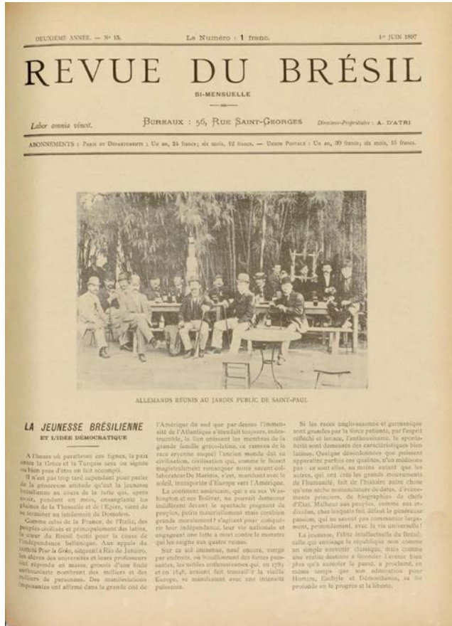
Imagen 2 - "Allemands réunis au jardin public de Saint-Paul", Revue du Brésil, tapa del I de junio de 1897.

A continuación me detendré en el estudio de dos revistas publicadas en París hacia 1897: la Revista Moderna y la Revue du Brésil . Me interesa pensar en un doble movimiento en el que las publicaciones periódicas, enmarcadas en el conflicto bélico/discursivo, se conjugan con las disputas por la consolidación republicana. Por un lado, la prensa de revistas es determinante para la configuración del Brasil, en tanto República moderna, entre las elites burguesas del mundo. En ellas se presentan nociones del «Brasil for export» que buscan alinear a la joven República en los caminos del progreso y de la civilización (ver Imagen 2). Por otro lado, el alcance internacional que estas publicaciones han tenido nos ubica en una nueva escala que, paradójicamente, consolidó, hasta hoy en día, la pregnancia que Canudos como acontecimiento tiene en la definición nacional. Son dos sentidos que conviven en el término «sucesso»