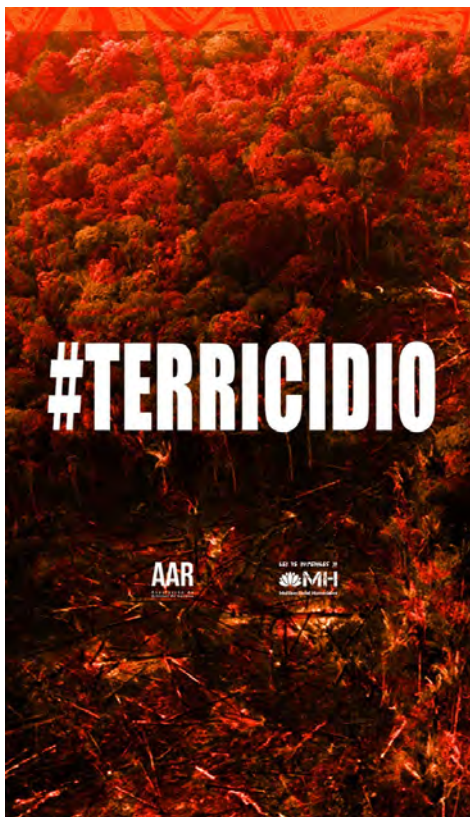
Imagen 1 Placa, Agitazo por los humedales , 2020. Bajo Licencia Creative Commons Atribución-CompartirIguual 4.0 Internacional

El segundo grupo de placas compartidas referidas a las “víctimas del sacrificio” fueron aquellas que contenían las demandas socioambientales de quienes las proyectaban: frases tales como “Basta de quemas” y “Ley de humedales ya”, un llamamiento tanto a detener la depredación del ambiente como a generar una política pública que lo proteja. Otras denunciaban el estado de situación medioambiental actual con la frase “No hay planeta B”. Esta frase, que circula en diferentes eventos de protesta contra el cambio climático y sus consecuencias, busca generar conciencia respecto de que no hay otra alternativa que salvar nuestro planeta de los daños que se le propinan cotidianamente. En estas placas, además, aparecía la autoría a modo de marca de agua con la mención a la Asociación de Artistas de Rosario (AAR).