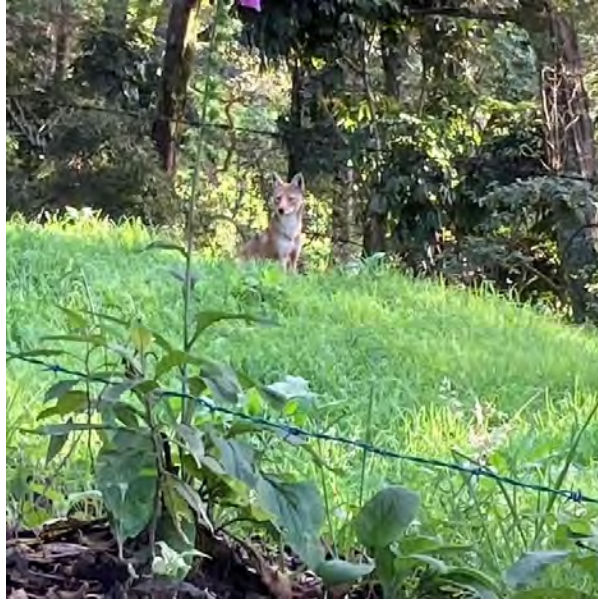
Figura 3: Un coyote es fotografiado en una zona con cobertura forestal, al lado de una de las principales vías de acceso a San Gerardo de Oreamuno. Este tipo de avistamientos no era común hace apenas un par de décadas, y no se tienen claros los motivos por los que el coyote «está saliendo» de las zonas más remotas de las áreas silvestres protegidas. A pesar de que la localidad ha experimentado la pérdida de bosque en los últimos años, este hecho explica solo en parte el cambio en el comportamiento de la especie. Por otro lado, a diferencia de otras especies, como el jaguar o la danta, el coyote no se considera «una especie sombrilla» en la gestión pública de la conservación de vida silvestre. Esto significa que el estado de la población o de los individuos no es determinante para el bienestar integral del ecosistema, o al menos ese es el criterio de algunos gestores de la conservación y funcionarios públicos, lo que implica que no se destinen recursos suficientes para la realización de estudios rigurosos de esta especie.