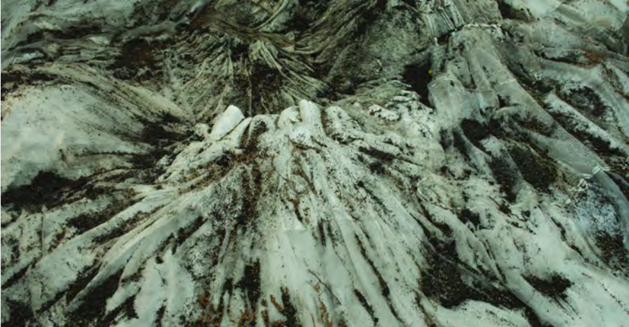
Topografía Alterada II (2015), instalación. Muestra Convivencias, Centro de Exposiciones SUBTE.

Aprender de la bioecocrítica en el centro de las humanidades ambientales: entrevista a Gisela Heffes [Sofía ROSA / Azucena CASTRO]