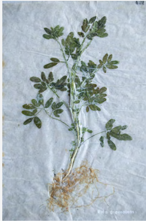
Cultivar el vacío, Herbarios aparentes (2021). Museo Nacional de Historia Natural.