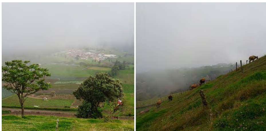
Figura 1: Vistas del territorio de San Gerardo de Oreamuno desde la cima del Cerro Pasquí. Abril de 2022.

En ese terreno, los hermanos Montenegro se dedican a la producción de hortalizas y la ganadería de leche (Figura 1). En el sitio que don Fabio me señaló, la familia había colocado una lona de plástico para impedir el paso directo del agua en la estación lluviosa y de los rayos del sol, durante los períodos secos. Ese espacio es utilizado por los Montenegro como centro de operaciones, el lugar donde reciben las excursiones que transportan a grupos de turistas interesados en visitar el Cerro Pasquí.