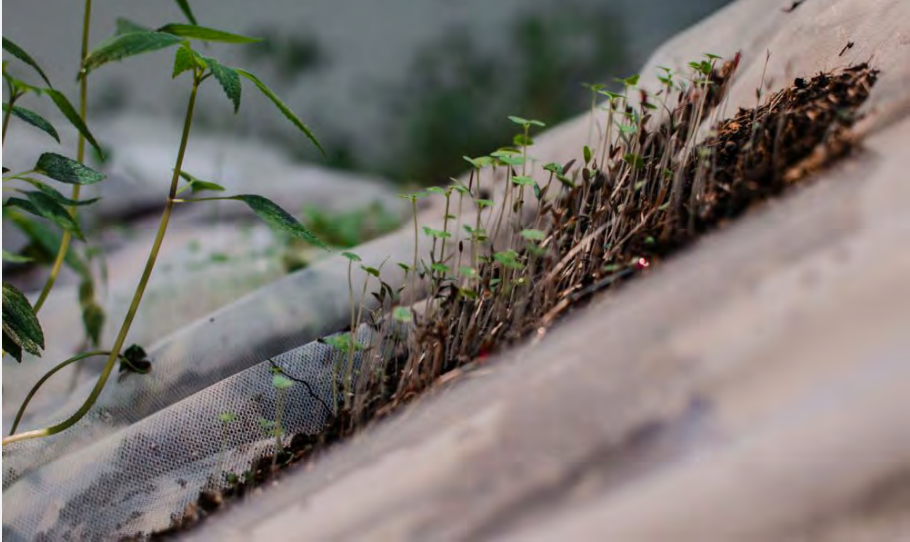
Topografía Alterada II (2015), Muestra Convivencias, Centro de Exposiciones SUBTE, (Montevideo, Uruguay).