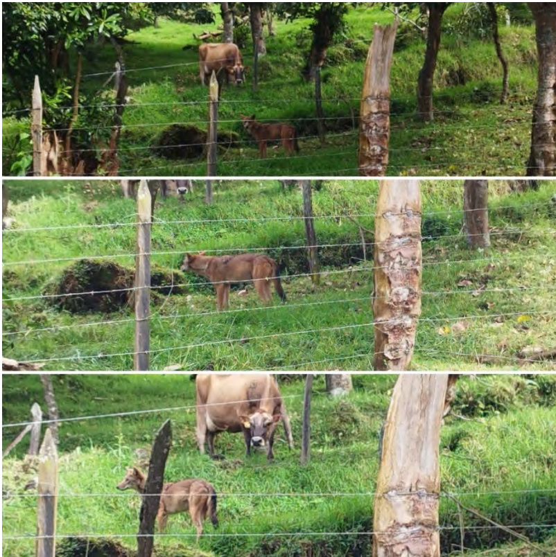
Figura 6: Un encuentro entre una vaca y un coyote en San Gerardo de Oreamuno.

de una situación en la que se produciría un ataque de coyote de un momento para otro. Las imágenes tratan sobre la interacción entre un individuo de esa especie y una vaca, aparentemente preñada. Se puede apreciar que la vaca adopta una posición de creciente incomodidad ante la presencia del coyote. A simple vista, parece que está molesta y busca el modo de mantener a su acosador a una distancia aceptable. Para entonces, el coyote ya ha percibido la presencia humana y parece confundido. Por su parte, la vaca mantiene su mirada puesta en el animal que tiene ante sí; y la posición de su cuerpo –cada vez más tenso– hace presuponer que se prepara para embestir: peso apoyado hacia su frente, cabeza agachada, orejas levantadas, patas delanteras apoyadas con firmeza.