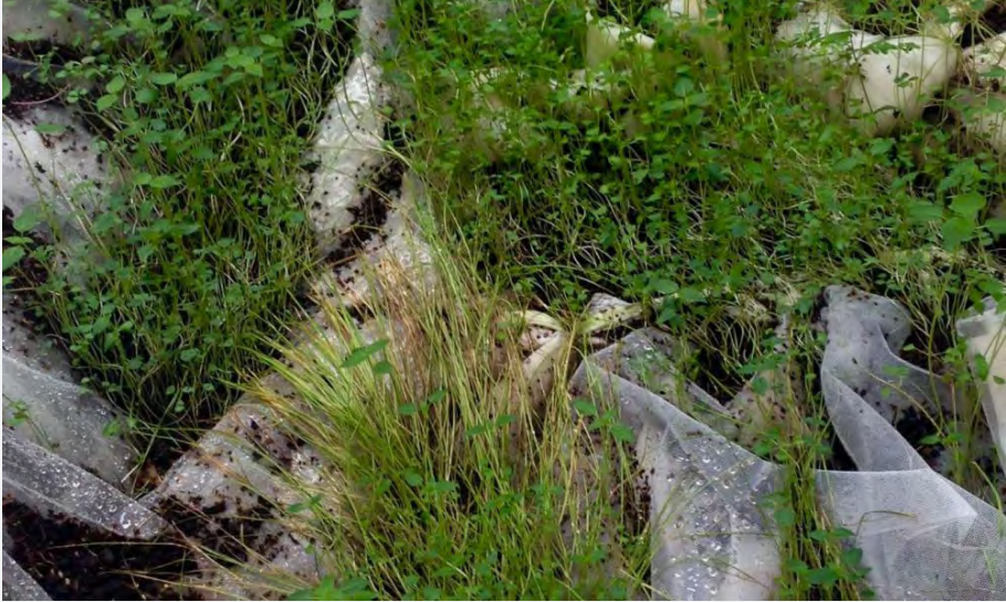
Topografía Alterada II (2015), detalle instalación. Muestra Convivencias, Centro de Exposiciones SUBTE.